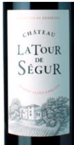
Château La Tour de Segur