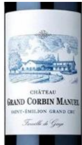
Château Grand Corbin Manuel